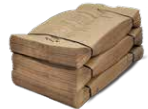
Matavfallspåse Volym: 9 liter

Bredd: 24,7 cm Djup: 19,7 cm Höjd: 28 cm