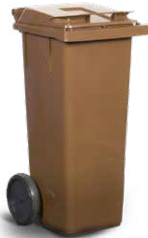
140 liter matavfallskärl med ventilation

Bredd: 77 cm Djup: 81,1 cm Höjd: 110,4 cm