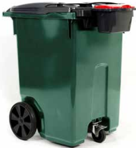
370 liter Sorterahemma med 4-facks insatser och batterilåda

Bredd: 77 cm Djup: 81,1 cm Höjd: 110,4 cm