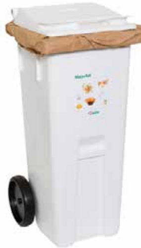
140 liter matavfallskärl för verksamheter

Bredd: 48,4 cm Djup: 55 cm Höjd: 106,5 cm